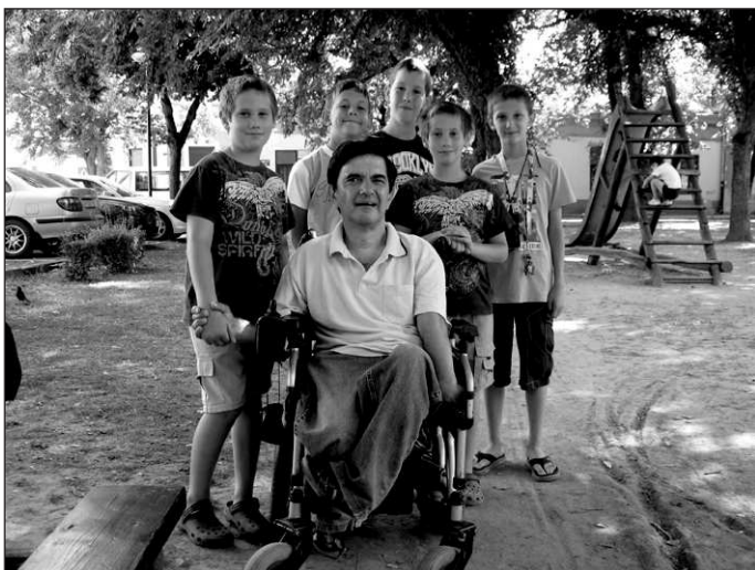
Nije bitno koji jezik govorimo: Mađarski, Engleski, Danski, Ruski, Grčki, Srpski, Španski, Arapski, bitno je da igramo šah jer je on najuniverzalniji jezik na 64 polja.