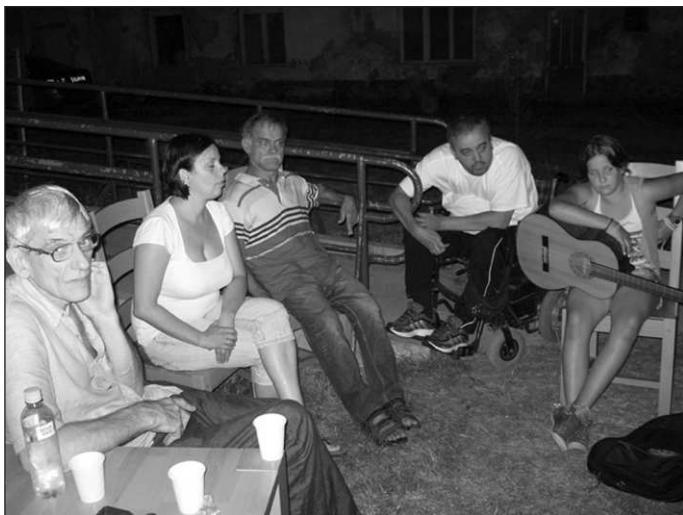
Bilo je tu muzike i druženja sa članovima ŠK Senta.

Već smo se osećali kao da tu živimo a ne da dolazimo svake godine. Turnir se igrao u Hotelu "Rojal", udaljeno oko kilometar i po od našeg prebivališta. Moram da naglasim, za ovih pet turnira koliko učestujemo, samo je dva dana padala kiša, što nije mala stvar jer mi idemo pešaka do hotela i nazad. Ove godine se i A i B turnir igrao u istoj sali zbog manjeg broja učesnika, kriza se oseća, no to nije smetalo da vidimo stara i upoznamo nova lica, drugim rečima, širimo krug iskrenih prijatelja kojima nije smetalo da se na ulici i bilo gde pozdrave i popričaju sa nama i upoznaju sa njihovim porodicama i prijateljima, dođu da provedu večer sa nama, gde smo smešteni. To je prava inkluzija i razbijanje predrasuda o osobama sa invaliditetom