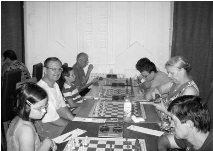
Kao i uvek, neko se radovao neko tugovao ali svi šah shvata-mo kao igru.

K ada vam se nešto dešava ili radite pet puta uzastopno, onda vam je to zaista dobro ili vama stvarno nije dobro. To "zaista dobro" se dešava ŠK "Pogledi", odnosno njegovim članovima, jer da nije ne bi se ponavljalo toliko puta. Naime, evo o čemu se radi. Međunarodni šahovski festival "Senčanska 1697 bitka", se preko deceniju i pol tradiciolno održava svake godine, treće nedelje jula u bačkom mestu Senta. I tako, dok se mnogi šahovski klubovi gase zbog finansijskih i drugih problema, ŠK "Pogledi" ostvaruje zapažene rezultate, ne toliko na takmičarskom polju, već na onom drugom polju zbog čega je klub i osnovan, a to je ravnopravno uključivanje osoba sa invaliditetom u društvenu sredinu što donekle igra, na šezdesetčetiri polja, omogućava. Kad kažem donekle, mislim na pisanje poteza, pomeranje figura i za slabovide posebne šahovske garniture, gde ima optora i nerazumevanja sa razlogom i bez razloga. No ipak, uz tolenraciju i razumevanje uvek se nađe rešenje na obostrano zadovoljstvo i tu sve predrasude padaju u vodu. Već