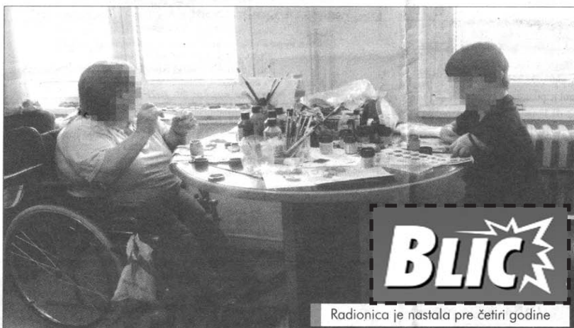
Radionica je nastala pre četiri godine

Članovi kreativne radionice "Vredne ruke" prave unikatni nakit od poludragog kamenja