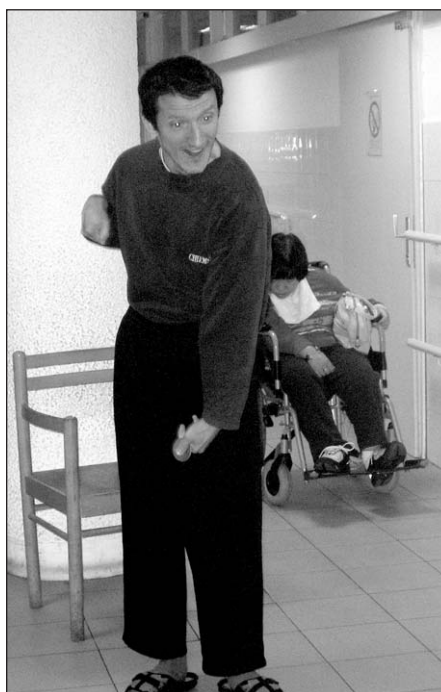
Čeda baca pločice

Udruženje stanara Doma organizuje razna takmičenja.